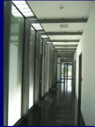
NEUBAU 2. BAUABSCHNITT HAUPTVERWALTUNG GRENKELEASING AG IN BADEN - BADEN FÜR ARCHITEKTURBÜRO AID IN BADEN -BADEN LEISTUNGSPHASE 5 + 6 2005