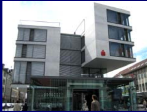
NEUBAU SPARKASSE ULM AUSCHREIBUNG FASSADENARBEITEN FÜR FASSADENBERATER ALFA PLAN GMBH 2005