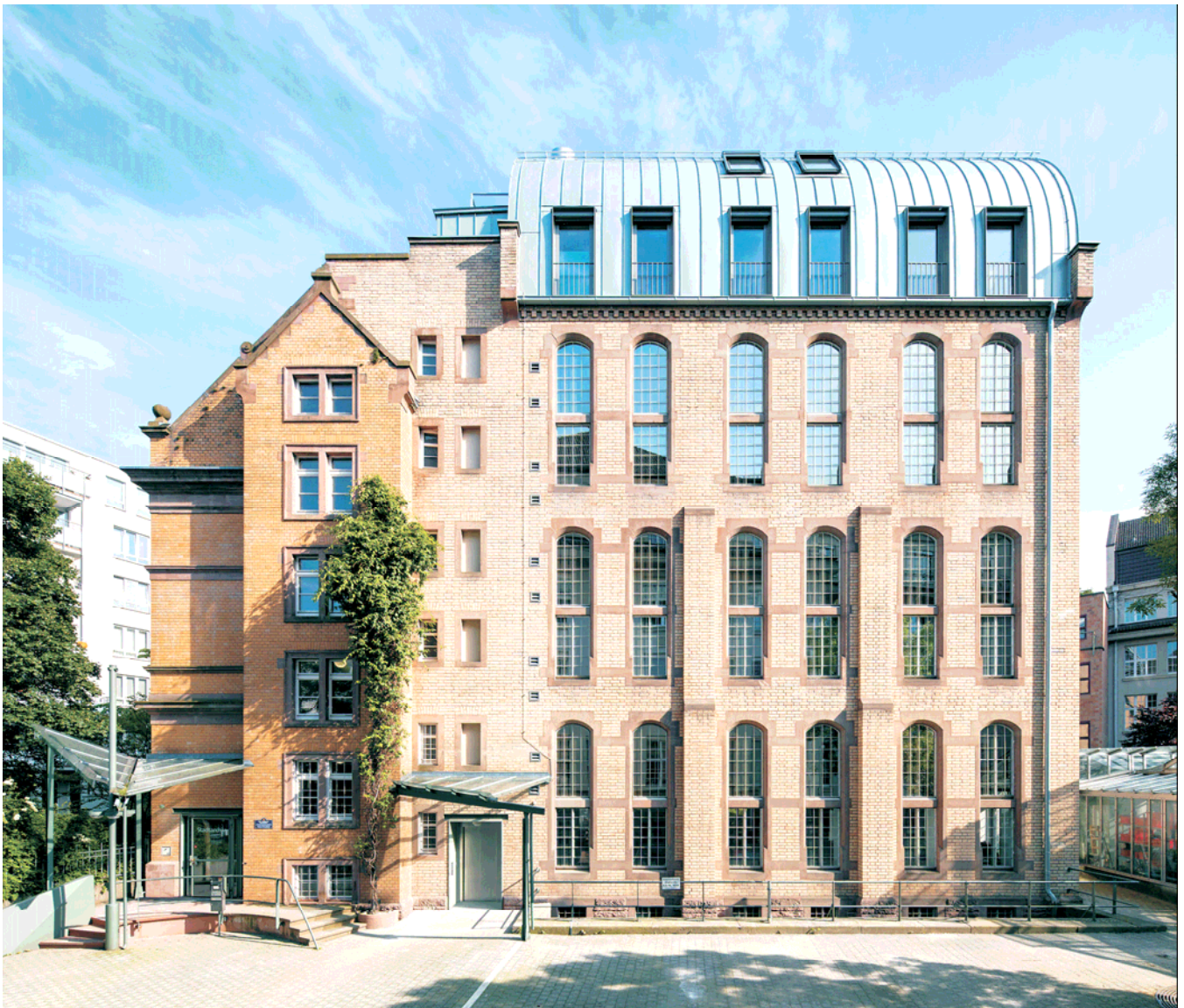
Nach der Aufstockung