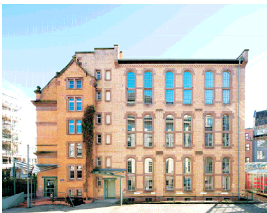
Vor der Aufstockung

Bauherr: Stadt Karlsruhe vertreten durch das Amt für Hochbau und Gebäudewirtschaft